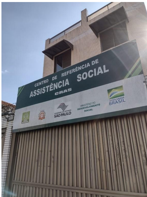
Visitas mensais ao CRAS CENTRO