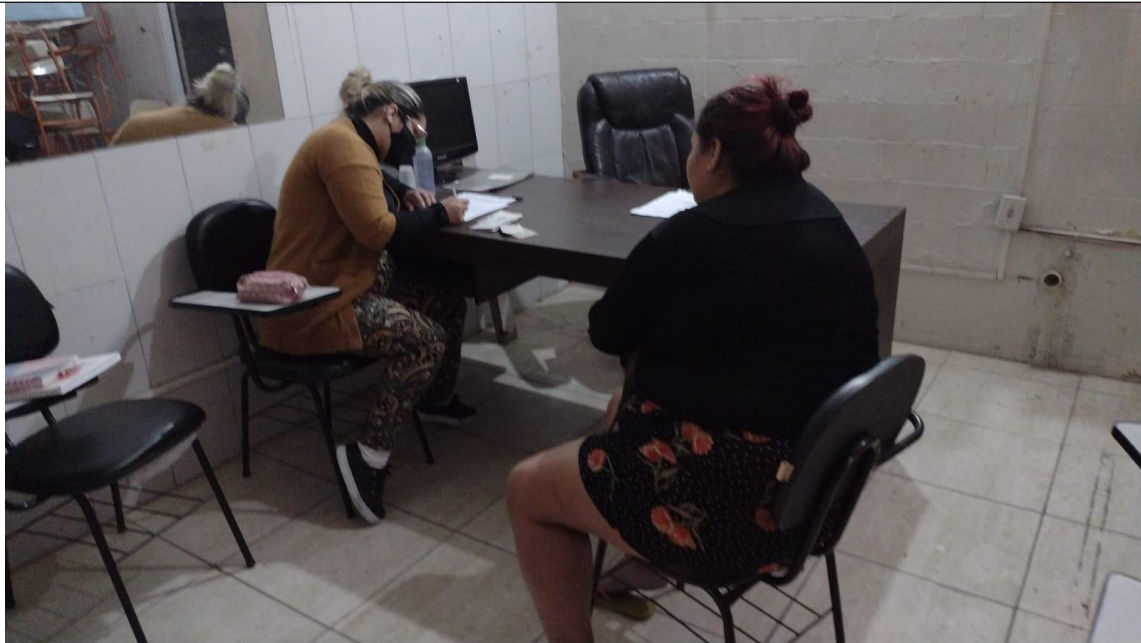
Atendimento Social e orientação às famílias do território feito pela estagiária em supervisão de campo.