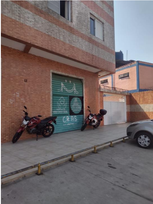
Visitas mensais ao CRAS Vila Margarida