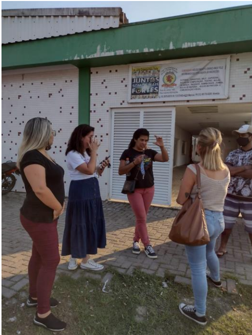
Plantões para orientação social de famílias e inserção nos coletivos.