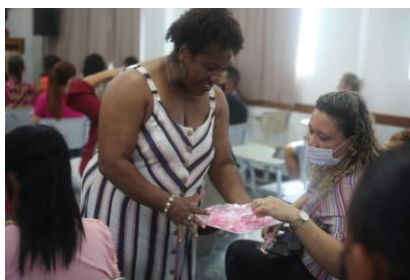
Cinema na OSC Bora Lá: